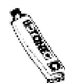
une crème une pommade